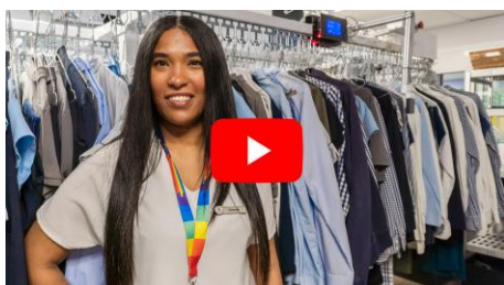
Η Κάουλα «έκανε το βήμα» και βρήκε δουλειά μέσω του Stepping Stone