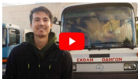
Διπλώματα οδήγησης που «οδηγούν» σε δουλειά και ένταξη

Συνεχίστηκε η σειρά video METAdrasi Stories με την παραγωγή και δημοσίευση πέντε βίντεο-ιστοριών.